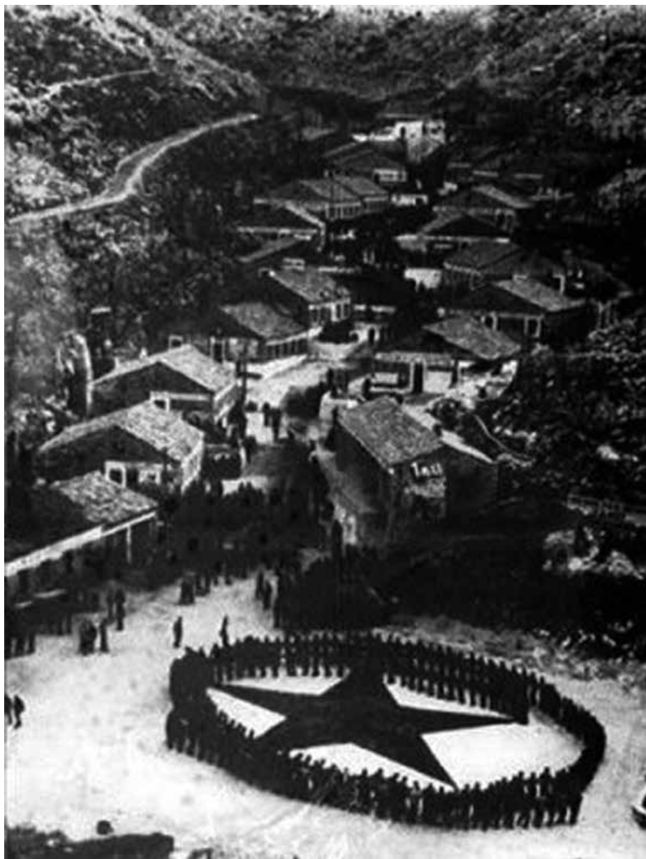
Mučilište na Golome u prvome razdoblju

Taj njihov idealizam na našem, domaćem – Krleža bi u ime svojih partijskih drugova rekao: balkansko-panonskom, jugoslavjanskom – terenu neminovno je