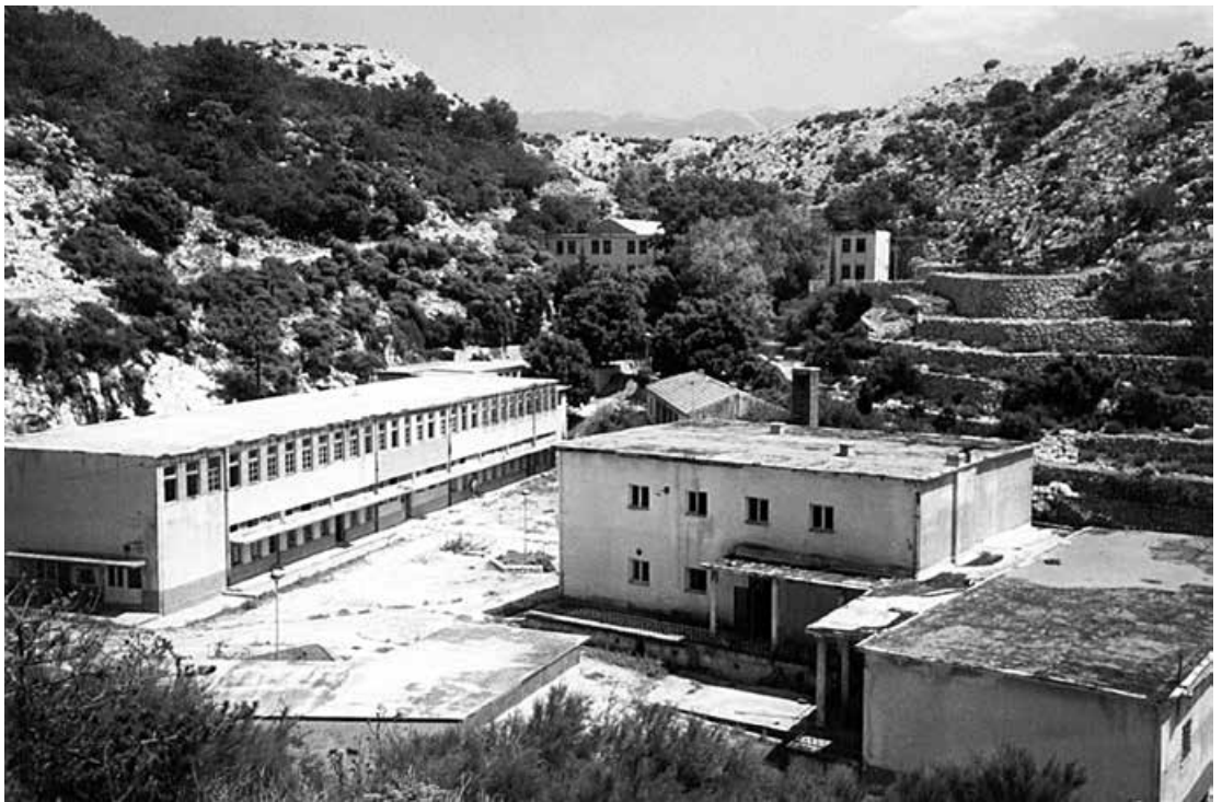
Pogled na „veliku žicu“ na Golome 1990.

Slabije upućeni to uopće ne će uočiti, jer on ne će prešutjeti nijedan dio tamošnjega zločinačkog instrumentarija; spomenut će višekratno i sovjetski sustav – doduše, nešto više prostora će, treba li čuditi, posvetiti fašističkim i nacističkim (nacional-socijalističkim!) uzorima jugoslavenskih komunista (247.-258.), jer da su oni bili nadahnuti ponajviše upravo potonjima (541.) – ali će ustvrditi da je režim na Golome ublažavan već od 1951., pri čemu da je „nasilje i dalje bilo sporadično prisutno na Golom otoku sve do 1956.“ (478.), kad je, prema njegovu mišljenju, logor i zatvoren (541.).