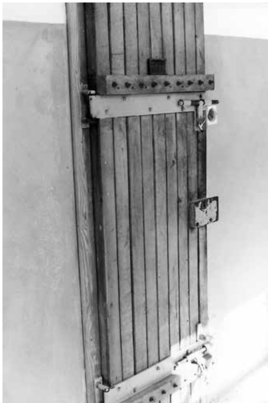
Vrata golootočke samice 1993.

No, poput većine povjesničara koji pišu o temama za koje je nezaobilazno poznavanje elementarnih pravnih pojmova,