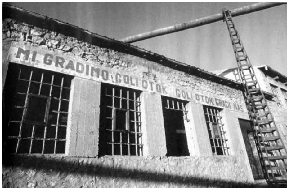
Znameniti natpis: „Mi gradimo Goli otok, Goli otok gradi nas“