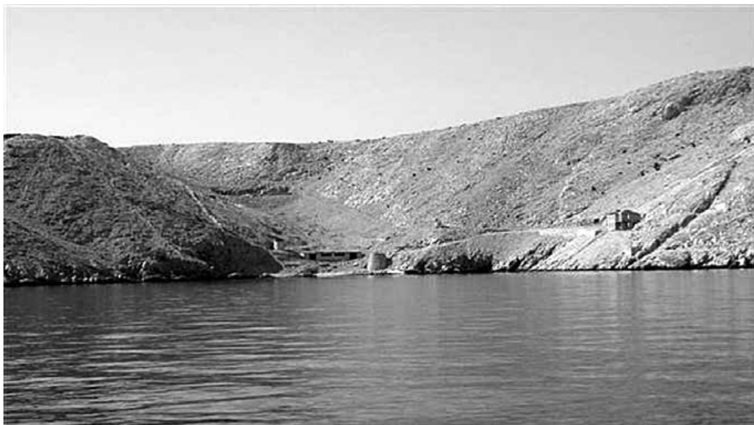
Pogled na ostatke ženskog logora na Golome

Zato je u arhivskome gradivu moguće pronaći podatak da je većina ibeovaca kažnjena „administrativnim (upravnim) putem“ (144.) – zapravo u tzv. administrativno-kaznenom postupku (jer je, for-