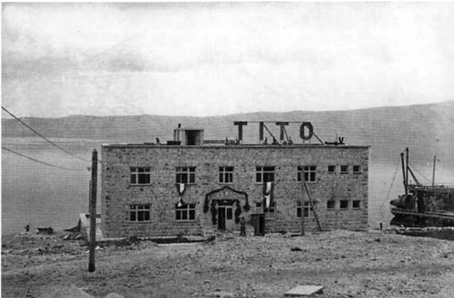
Tzv. kamena zgrada, izgrađena 1949.

imao iste ili slične plodove: njegovi su vjernici učinili sve što je moguće da samostalna hrvatska država (sasvim svejedno: ustaška, neustaška ili protuustaška) ne opstane, nego da se obnovi Jugoslavija, ta nakaza koja je svojedobno i u partijskom žargonu, dok se je to Kominterni bilo prohtjelo, nazivana tamnicom naroda, i da se u njoj obnove stari instrumenti ropstva, naturalia negotii svakog oblika jugoslovenstva, sad obogaćeni boljševičkom inventivnošću: žicom i noževima, jamama, tenkovskim jarcima, rudničkim iskopima i sličnim drangulijima koje su nam dragi naši uzorni i učeni drugovi širokom rukom dijelili od 1941., a osobito nakon što smo 1944./45. imali nesreću pasti pod oslobođenje.