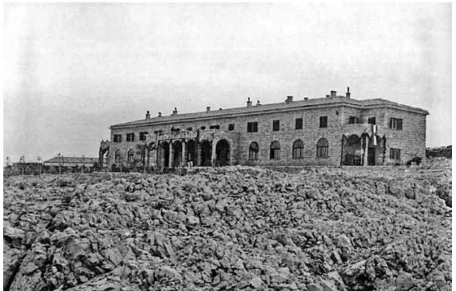
Golootočki "hotel" (1950.)

Nju uopće ne primjećuje autor koji vrlo suvereno govori, recimo, o „jugoslavenskom nacionalnom komunizmu“ (54., 546.) – pa ostaje malne frojdovska zagonetka, koja je to nacija što ju je taj komunizam predstavljao ili njezine interese zastupao da bi ga se moglo nazvati